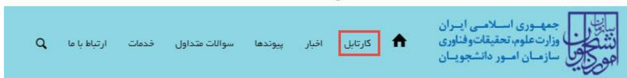
تصویر 8- کارتابل شخصی

با دریافت پیغام جهت مراجعه به پورتال، برای مشاهده وضعیت خود اقدام نمایید. از طریق پورتال سازمان امور دانشجویان سربرگ کارتابل را انتخاب نمایید. (تصویر 8)