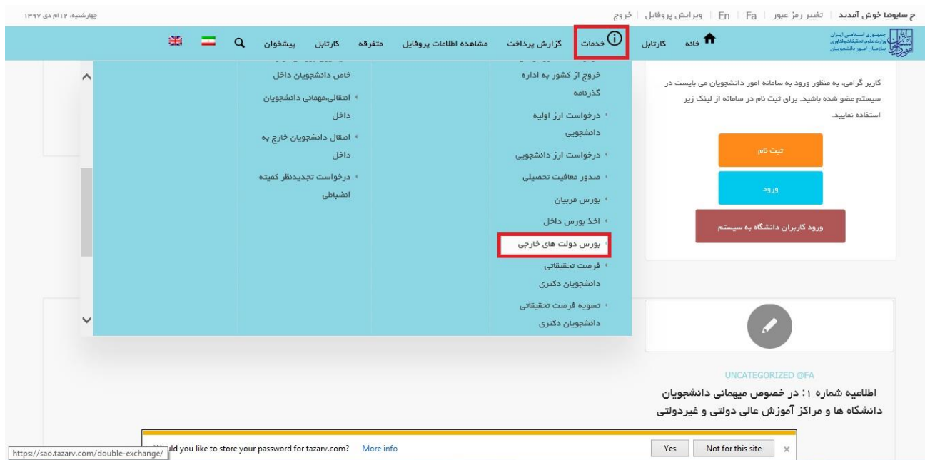
تصویر ۱-نمایش پورتال

از طریق پورتال سازمان امور دانشجویان و از سربرگ خدمات، بخش اداره کل بورس و اموردانشجویان خارج را انتخاب کرده و سپس در این قسمت جهت ثبت درخواست بر روی بورس دولت های خارجی کلیک نمایید.(تصویر 1)