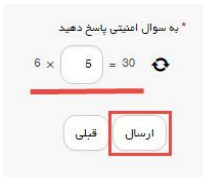
تصویر ۶-سوال امنیتی

سپس به سوال امنیتی پاسخ داده و بر روی دکمه ارسال کلیک کنید.(تصویر 6)