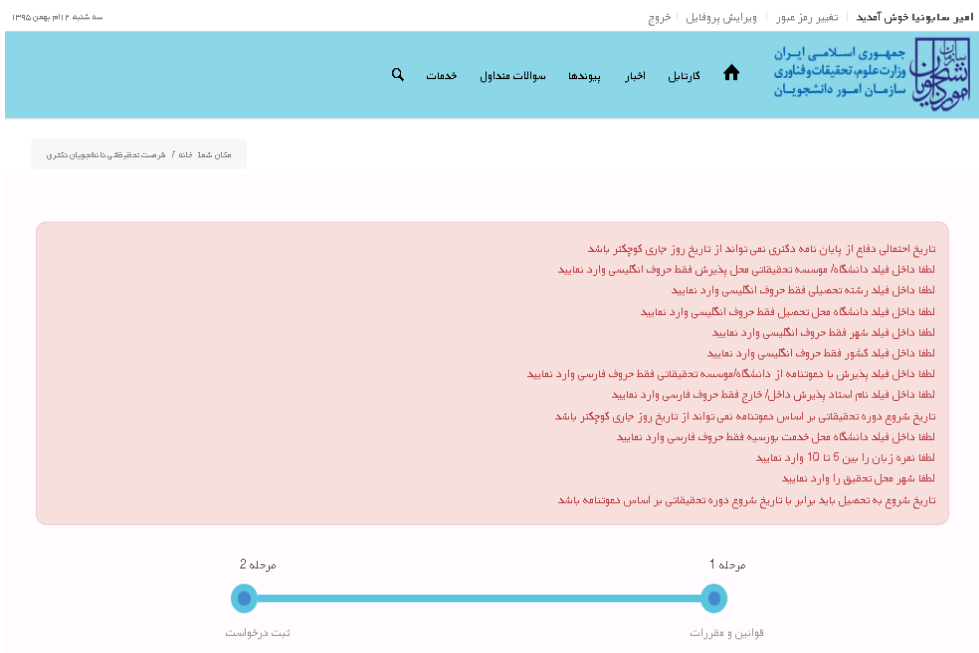
تصویر ۶-اعتبارسنجی فیلد های اجباری

همچنین در صورت وجود مغایرت، سیستم موارد را به صورت تصویر زیر در بالای صفحه نمایش می دهد.(تصویر ۶)