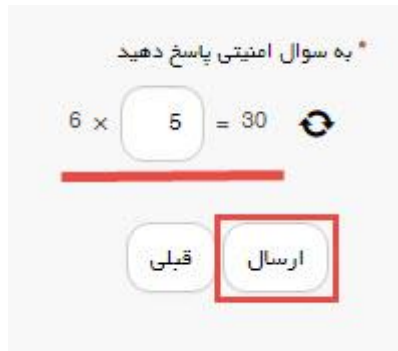
تصویر ۴-سوال امنیتی

سپس به سوال امنیتی پاسخ داده و بر روی دکمه ارسال کلیک کنید.(تصویر ۴)