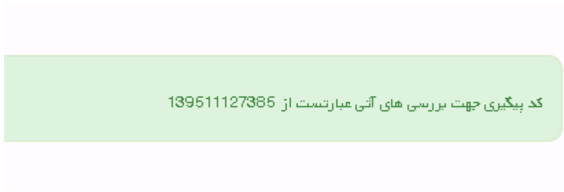
تصویر ۷-کد پیگیری

در صورت موفقیت آمیز بودن ثبت، سیستم کد پیگیری را در اختیار شما قرار می دهد.(تصویر ۷)