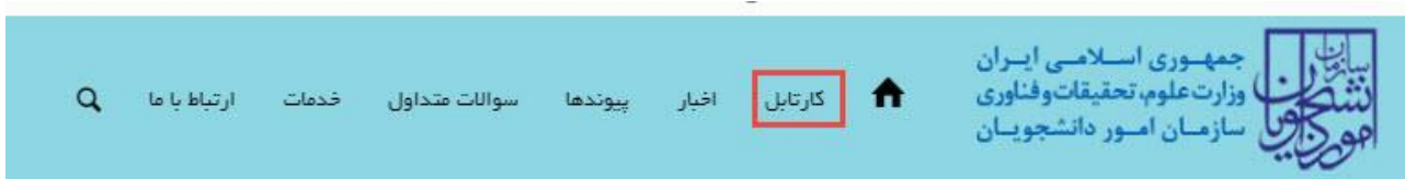
تصویر ۸-کارتابل شخصی

با دریافت پیغام جهت مراجعه به پورتال، برای مشاهده وضعیت خود اقدام نمایید. از طریق پورتال سازمان امور دانشجویان سربرگ کارتابل را انتخاب نمایید.(تصویر ۸)