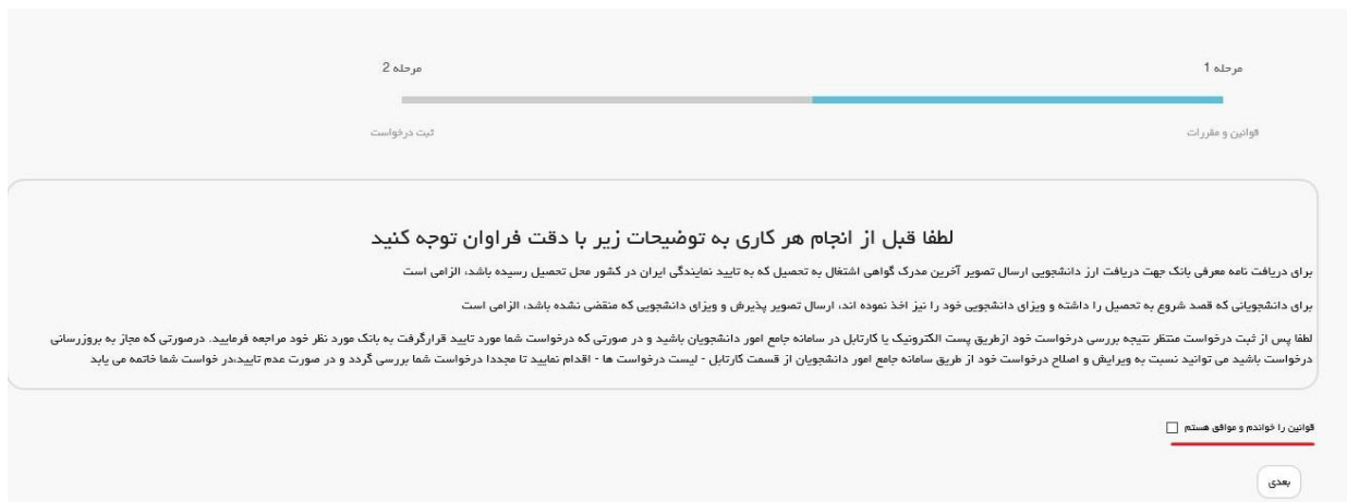
تصویر ۲-موافقت با قوانین گفته شده

دکمه بعدی، فرم تسویه فرصت تحقیقاتی دانشجویان دکتری به شما نمایش داده می شود. (تصویر ۲)