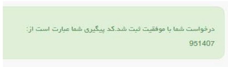
تصویر ۷-نمایش کد پیگیری

در صورت ناموفق بودن تراکنش سیستم پیغام زیر را نمایش داده و امکان رفع مشکل و سعی مجدد را برایتان فراهم می نماید.(تصویر