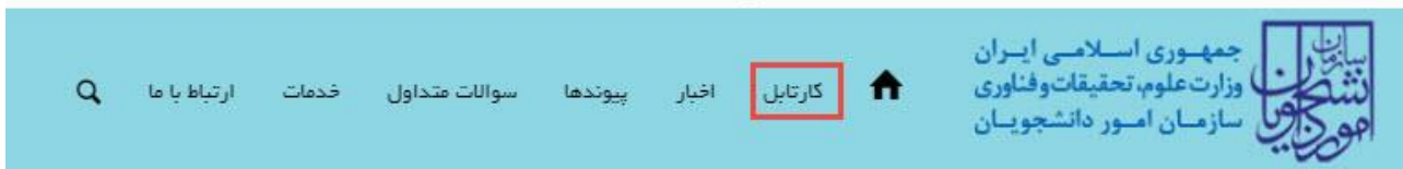
تصویر ۹-کارتابل شخصی

در قسمت جستجو کد پیگیری دریافتی را وارد و با توجه به توضیحات ذکر شده جهت ادامه فرآیند اقدام نمایید.سپس بر روی