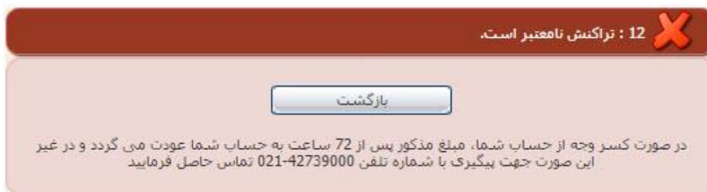
تصویر ۸-نمایش اخطار تراکنش ناموفق

با دریافت پیغام جهت مراجعه به پورتال، برای مشاهده وضعیت خود اقدام نمایید. از طریق پورتال سازمان امور دانشجویان سربرگ