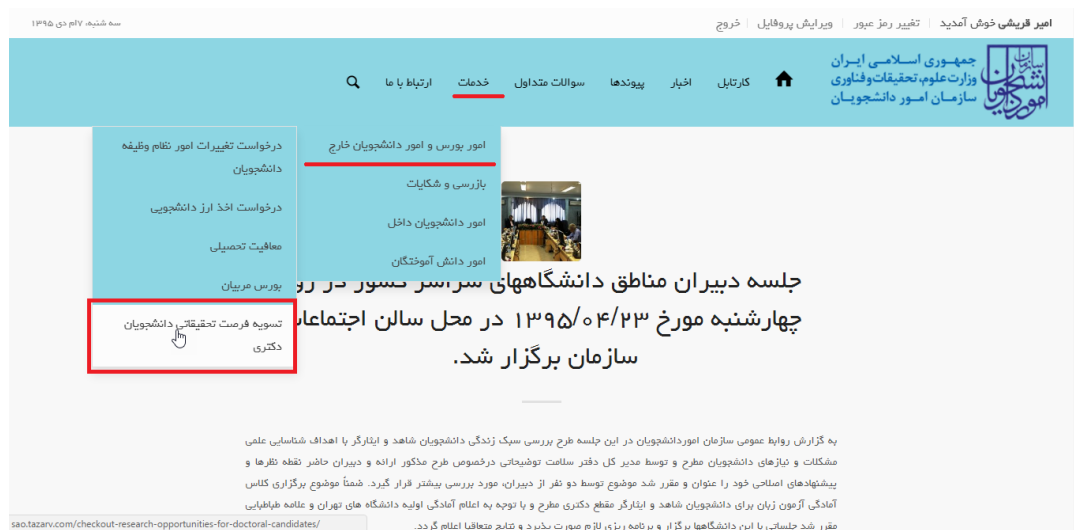
تصویر ۱-نمایش پورتال

در این قسمت جهت ثبت درخواست بر روی تسویه فرصت تحقیقاتی دانشجویان دکتری کلیک نمایید. (تصویر ۱)